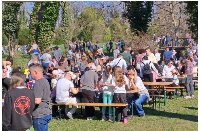
Alle Plätze beim Buchenviertelkreis waren sofort besetzt.