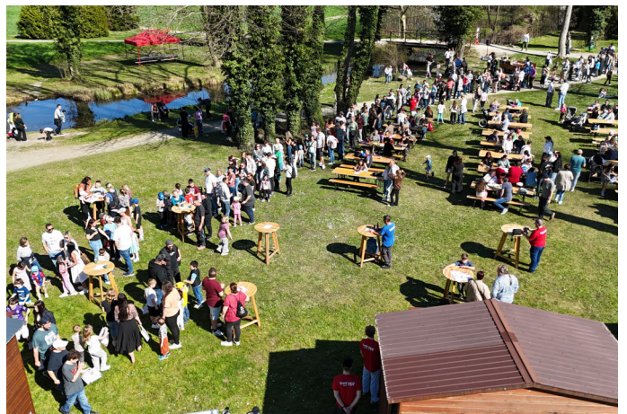
Gleich zu Beginn holten sich alle die begehrten Ostereiersammelsackerl.

Impressum: Offenlegung lt. § 25 des Mediengesetzes: Name des Medieninhabers: SPÖ Großgemeinde Pottendorf. Unternehmungsgegenstand: "erzähl.mal" Informationsblatt der SPÖ Großgemeinde Pottendorf. Redaktion und für den Inhalt verantwortlich: Thomas Sabbata-Valteiner / Gerd Kiefl, 2486 Pottendorf, Alte Spinnerei 2/7. Für namentlich gekennzeichnete Beiträge übernimmt der Unterzeichner die Verantwortung für diesen. Druck: Wograndl GmbH.