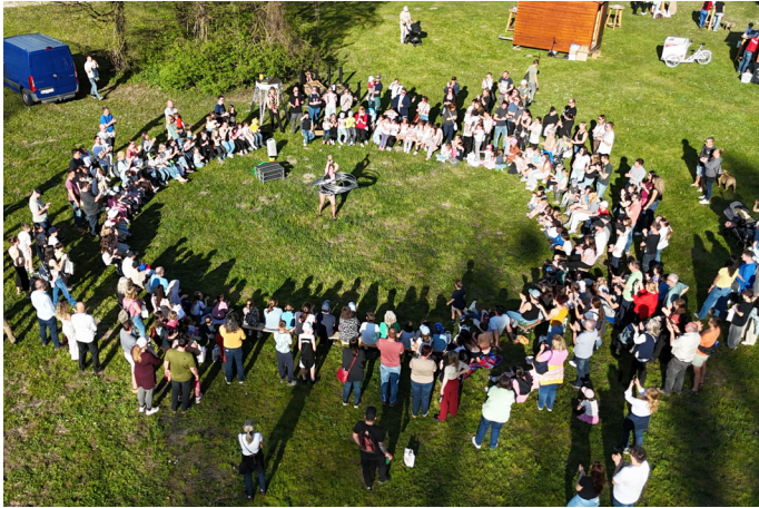
Sondervorstellung des Circus Pikard.

Ein weiterer Höhepunkt war eine Sondervorstellung des Circus Pikard, die begeistert verfolgt wurde.