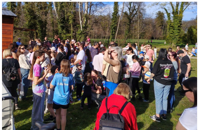
Alle warteten geduldig auf die Verlosung. Der Hauptpreis: ein 50 Euro Eisgutschein.